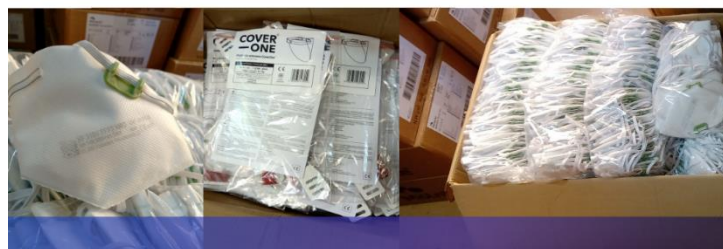
Fundacja Agencji Rozwoju Przemysłu wspiera Instytut w walce z Covid-19. Dzięki Fundacji ARP zakupiono środki ochrony osobistej: przyłbice dla dorosłych i dzieci, półmaski filtrujące FFP3 i jednorazowe maseczki ochronne